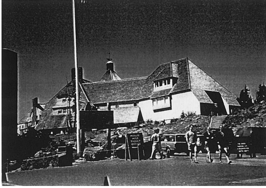
図 1. SOTA2003 が開催された Timberline Lodge.