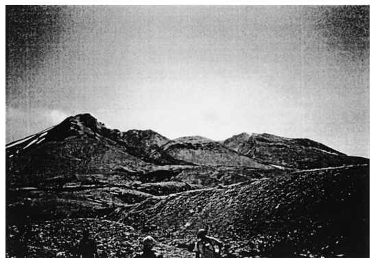
図3. カルデラの脇から撮影した Mt. St Helens。