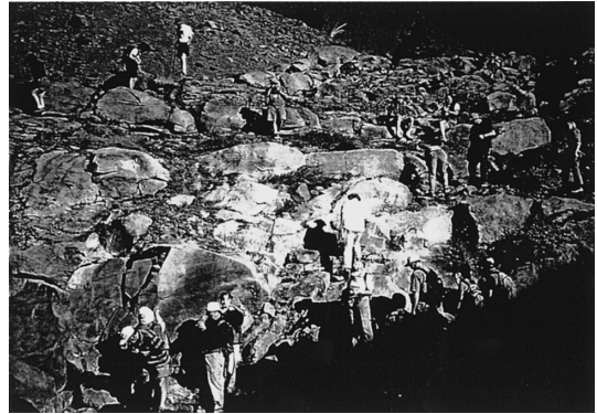
図 4. Mt. Hood の安山岩質溶岩を見学する巡検参加者。

SOTA 2003 の報告は http://www.ruf.rice.edu/~leeman/SOTA2003/info.html にて読むことができるので，詳しい内容はそちらを参照頂きたい。次回の SOTA 2006 は南米のチリで行われる予定である。