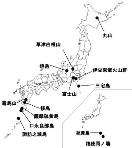
図 1. 2011年7月～8月に目立った活動があった火山