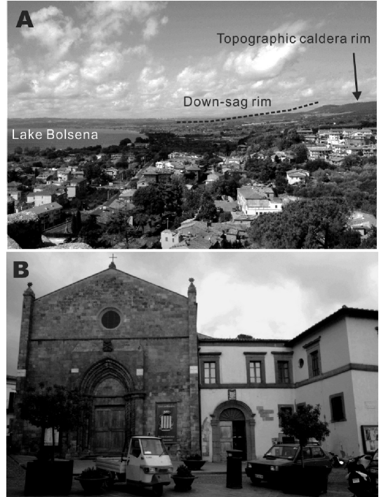
Fig. 2. A : Northern part of the Bolsena Caldera from Bolsena Castle. Wide and gently-sloped caldera rim indicates the down-sag deformation. B : Stone-building church and town-hall, in which the workshop was held. The stone blocks of these buildings are the ignimbrites of Vulsini Caldera Complex.

カルデラ噴出物のセッションでは、Ray Cas ほかによる基調講演が行われ、カルデラは径 100 km に及ぶ巨大カルデラと径数 km の小型のカルデラの二つの端成分があること、これらのカルデラの規模や構造は、カルデラが存在する地殻の年代に規制されている可能性が指摘された。数 100~1000 km 3 の珪長質マグマが噴出する巨大